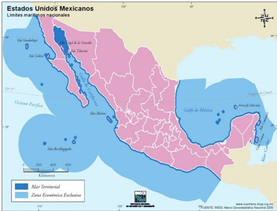
Fig.2. Zona Económica Exclusiva Mar Territorial México